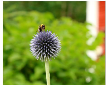
Pörräiset viihtyvät puutarhan vanhoissa perennoissa.