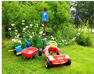
Pienille vierailijoille on pihalla omat kulkuvälineet ja parkkipaikka.