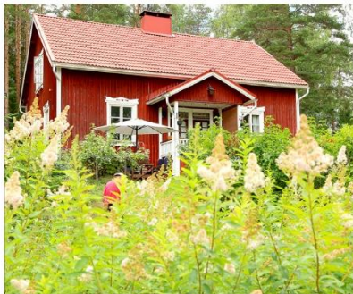
Honkalassa asui aikoinaan neljä perhettä.